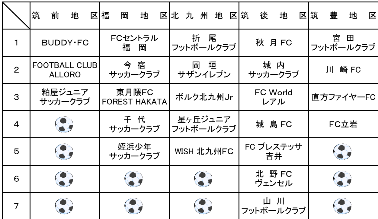
予選リーグパート分け表